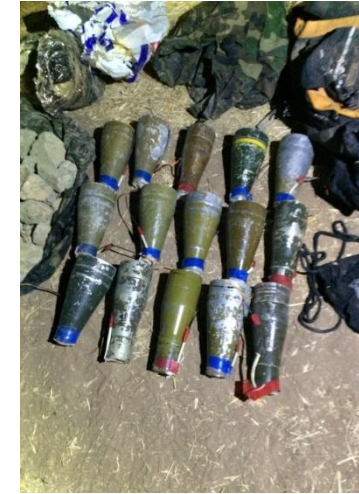
Cizre/Aşağı Konak Köyü