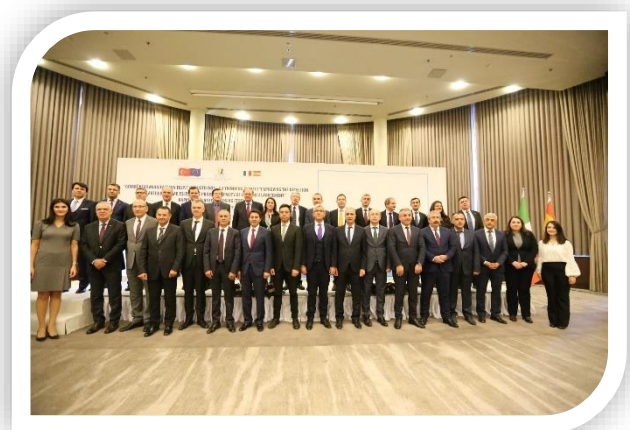
Eşleştirme Bileşeni Kapanış Etkinliği (12 Kasım 2019)