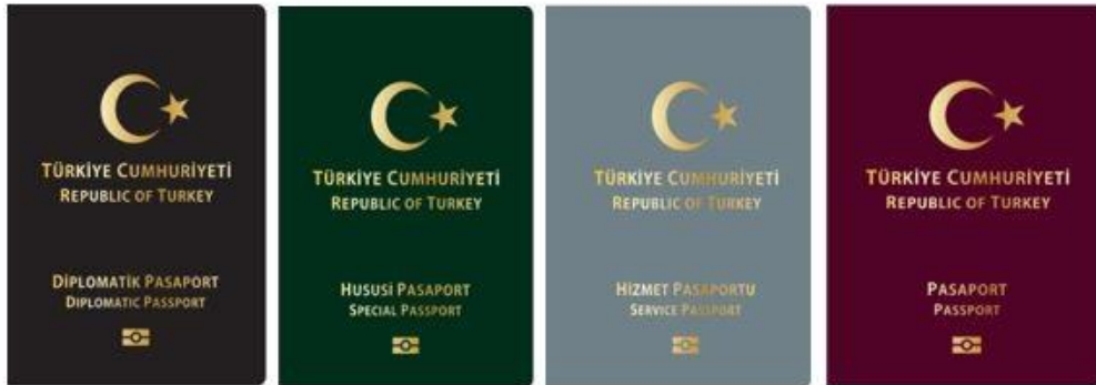
Tedarik edilen pasaport defterleri