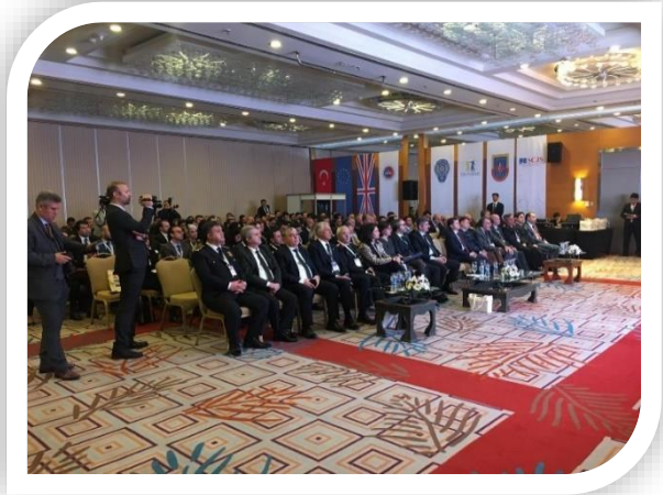
Proje Açılış Etkinliği, Ankara