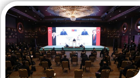
Seyahat Belgelerinde Sahteciliğin Tespiti ve Risk Analizi Konularında Emniyet Genel Müdürlüğü ve Diğer Kolluk Birimlerinin Kapasitesinin Artırılması Projesi Açılış Etkinliği, Ankara (23 Mart 2021)

işbirliğiyle yürütülen proje kapsamında çok sayıda eğitim faaliyeti, kurumlar arası koordinasyon ve işbirliği toplantıları ile yurtdışı çalışma ziyaretleri düzenlenmiştir.