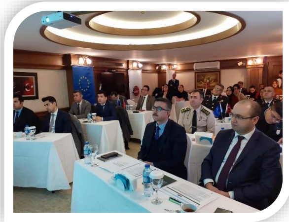
Proje kapsamında gerçekleştirilen Eğitim Stratejisi ve Müfredat Hazırlama Çalıştayı, Ankara (11-12 Şubat 2020)

Proje kapsamında Teknik Destek bileşeniyle ayrıca sınır yönetimi ve düzensiz göçle mücadele konusunda kurumsal kapasitenin geliştirilmesi hedeflenmektedir. Kara Kuvvetleri Komutanlığı personeli ve sınır yönetiminde görev yapan Göç İdaresi Başkanlığı, İller İdaresi Genel Müdürlüğü, Emniyet Genel Müdürlüğü, Jandarma Genel Komutanlığı ve Sahil Güvenlik Komutanlığı personeline AB sınır mevzuatı, entegre sınır yönetimi sistemi, FRONTEX modeli risk analizi, sınır güvenliği ve göç alanlarında eğitimler verilmiştir. Toplamda 5 Avrupa Birliği ülkesine sınır yönetimi birimlerinin iyi uygulama örneklerini görmek ve karşılaştırmalı analizler yapmak amacıyla 5 çalışma ziyareti gerçekleştirilmiştir. Teknik destek bileşeni tamamlanmış tedarik bileşeninin ise elektrik altyapısı ile ilgili çalışmalar devam etmektedir.