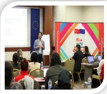
Göç Yönetiminde Odak Grup Çalışmaları, İstanbul (22-23 Ekim 2019)

Göç İdaresi Başkanlığı tarafından yürütülen ve Mart 2022’de tamamlanan proje ile göç konusunda kamu-sivil toplum diyalogu sağlanarak deneyimlerin paylaşılması, sivil toplum örgütlerinin kapasitelerini artırarak karar alma mekanizmalarına katılmalarını sağlamak ve bu yolla demokratikleşme sürecine katkı sunmak amaçlanmaktadır.