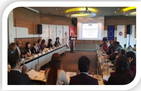
Proje kapsamında düzenlenen Uluslararası Dil Analizi Çalıştayı, İstanbul (22-23 Ocak 2020)

Proje kapsamında dil analistleri ve dil bilimcilerin istihdamının yanı sıra Aksan Tanıma Yazılımı geliştirilerek ses kaydı incelemeleri yapılmıştır.