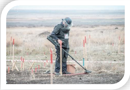
Mayın Temizliği Faaliyeti

mayınlı arazilerin temizliğinin sağlanması ve MAFAM personeline mayın temizliği konusunda eğitimler verilmesi planlanmaktadır. Projenin sonunda Ardahan, Kars, Iğdır ve Ağrı-Doğubayazıt'ta bulunan 4.200.000 m 2 'lik mayınlı alan mayından arındırılmış olacaktır. Projenin 2023 yılı Aralık ayında tamamlanması öngörülmektedir.