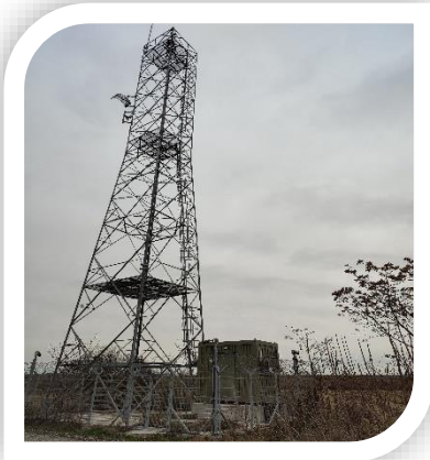
Sınır Gözetleme Kulesi

Türkiye'nin doğu sınırında sınır gözetim sistemlerinin modernizasyonu sağlanarak sınır güvenliği ve gözetiminin desteklenmesi amacıyla İller İdaresi Genel Müdürlüğü tarafından Kara Kuvvetleri Komutanlığı ile birlikte yürütülen proje, 14 Şubat 2019 tarihinde başlamıştır. Proje ile doğu sınır hattının %60'ının etkin ve kesintisiz şekilde gözetlenmesini sağlayan gözetleme sistemleri tedarik edilmiş; Kars, Ağrı, Iğdır, Van ve Hakkâri illerinde kurulmaya başlanmıştır. Toplam 4 Lottan oluşan sözleşmeyle 341 noktada elektro-optik güvenlik sistemlerinin kurulumu tamamlanmıştır. Proje kapsamında elektrik altyapısıyla ilgili çalışmalar tamamlandıkça geçici kabul işlemleri de tamamlanarak sistem kullanıma alınmaktadır.