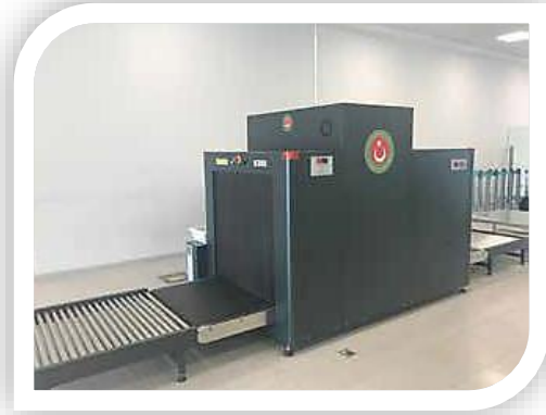
Bagaj Tarama Sistemi