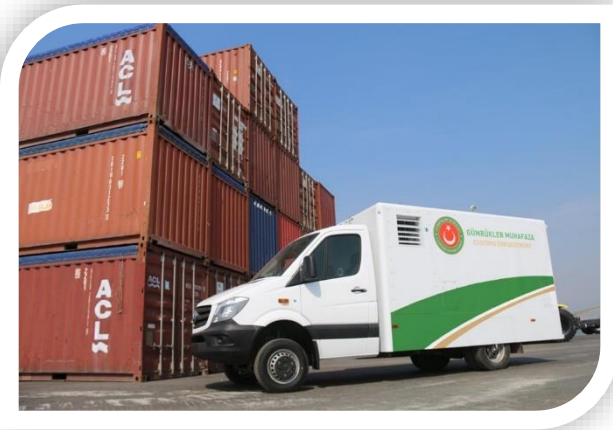
Proje kapsamında temin edilen Backscatter Mobil Tarama Sistemi

Ayrıca proje kapsamında Veri Yönetimi ve Hedefleme Yazılımı geliştirilmiştir. Makine öğrenimi, derin öğrenme, büyük veri ekosistemi ve özel bulut altyapısını barındıran yazılım sistemi sayesinde manuel yöntem ve analizler ile ortaya çıkarılması zor ilişki ve risklerin ortaya çıkarılması ve gelecekteki gümrük kontrol yazılım programlarının desteklenmesi yoluyla kaçakçılıkla mücadelede etkinliğin artırılması amaçlanmaktadır.