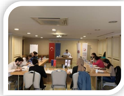
Daha Güçlü Sivil Toplum Eğitimi, Ankara (5-6 Şubat 2020)

Proje kapsamında ulusal düzeyde göç ve uluslararası koruma alanında aktif olarak çalışan STK’lar haritalandırılmış ve eğitim modülleri tasarlanarak STK temsilcilerine yönelik eğitimler