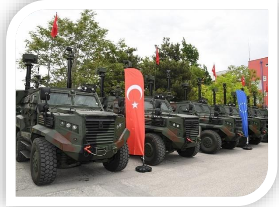
Keşif Gözetleme Araçları

Projenin 2023 yılının Eylül ayında tamamlanması beklenmekte, tedarik edilen sistemler ve araçlarla etkin ve kesintisiz sınır gözetimi gerçekleştirilmesi hedeflenmektedir.