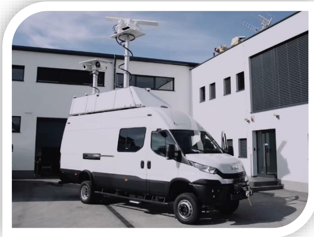
Mobil Radar Aracı

Mart 2019’da başlayan proje ile Sahil Güvenlik Komutanlığının sorumluluk sahasındaki faaliyetlerin karadan tespiti, teşhisi, takibi ve değerlendirilmesi ile yasa dışı olayların tespitinin sağlanması amaçlanmaktadır. Proje kapsamında 10 adet Mobil Radar Aracı alınarak Sahil Güvenlik Komutanlığının kullanımına sunulmuştur. Mobil Radarlar Türk Sahil Güvenliğine organize suç ve düzensiz göçle mücadelesinde önemli katkılar sağlamaktadır.