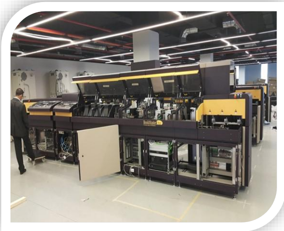
Endüstriyel pasaport basım makinesi

* https://www.nvi.gov.tr/pasaport-ve-surucu-belgelerine-iliskin-devir-toreni