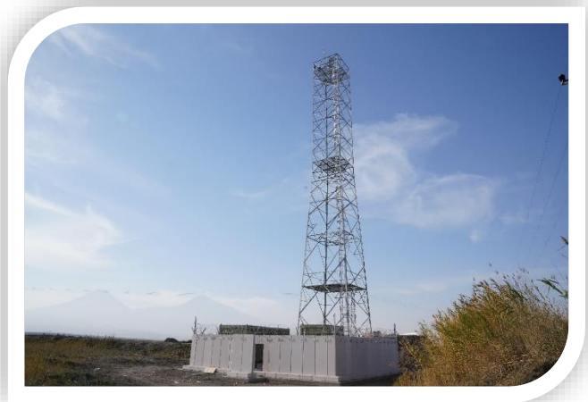
Sınır Gözetleme Kulesi