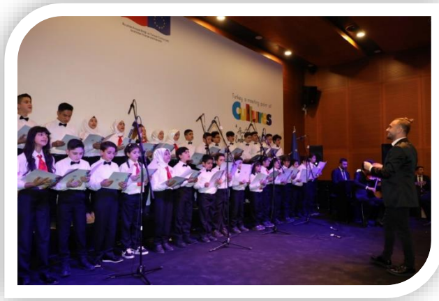
Göçmenler Günü Etkinliği, Eskişehir (18 Aralık 2019)

Göç İdaresi Başkanlığı tarafından yürütülen proje, Aralık 2018'de başlamış ve Mayıs 2022'de tamamlanmıştır. Proje ile farkındalık yaratma ve iletişim stratejisi geliştirilerek yabancılarla ilgili yerel yetkililerin, medyanın ve STK'ların bilinçlenmesini sağlamak; bir arada yaşamayı ve karşılıklı uyumu geliştirmek, olası çatışmaları ve yabancı düşmanlığını bertaraf etmek amaçlanmaktadır.