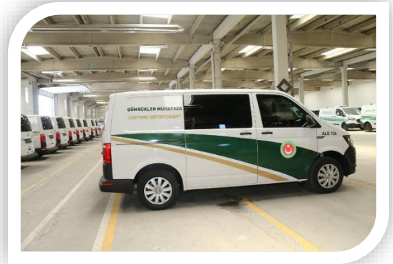
Detektör Köpek Nakil Aracı