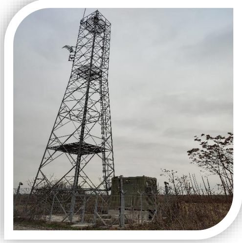
Sınır Gözetleme Kulesi

Türkiye'nin AB sınırında sınır gözetim sistemlerinin modernizasyonu sağlanarak sınır güvenliği ve gözetiminin desteklenmesi amacıyla İller İdaresi Genel Müdürlüğü tarafından Kara Kuvvetleri Komutanlığı ile birlikte yürütülen proje 29 Mayıs 2017 tarihinde başlamıştır.